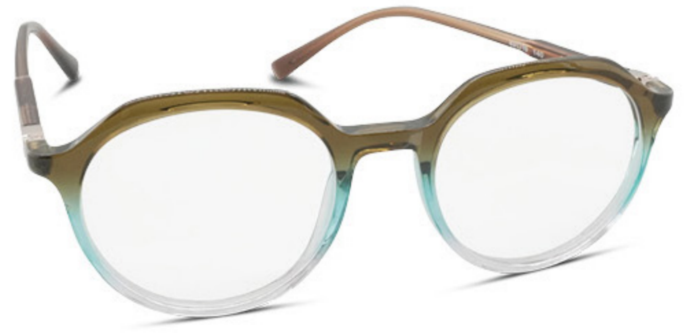
ANGELS Brillenfassung nur 159€