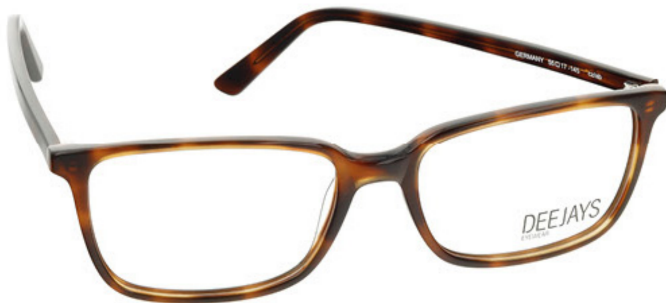
DEEJAYS EYEWEAR Brillenfassung nur 89€

klares, scharfes Sehen im Arbeitsalltag, im Nah,- und Mittelbereich, -schnelles Fokussieren beim Blickwechsel von PC, Notizblock, Handy, -entspannte und bequeme Kopf,- und Körperhaltung